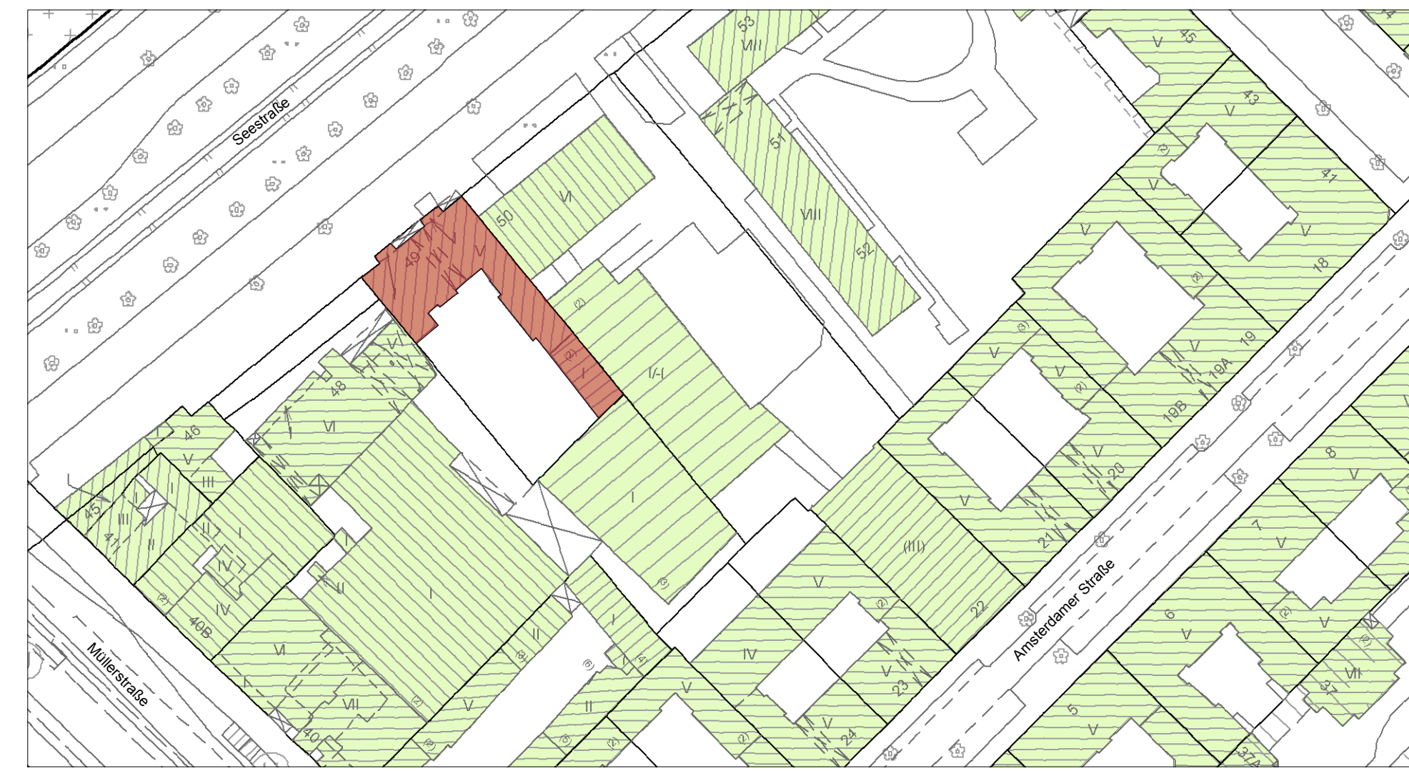
Lageplan M 1:1000